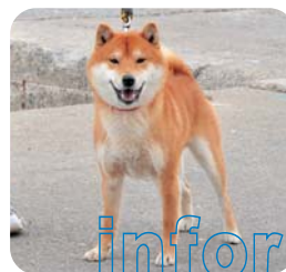
上村レオ(オス・2歳)