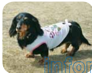
蟹江ナナ(メス・12歳)