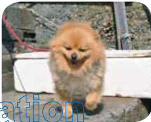
橋本りょう(オス・4歳)