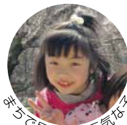
元気がみなぎるおどろき発見

広報とばに掲載された 写真を差し上げます。 ご希望のかたは、総務 課広報情報係まで。