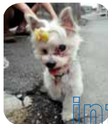
小崎理喜(オス・11歳)