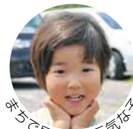
元気がみなぎって見かけた

広報とばに掲載された 写真を差し上げます。 ご希望のかたは、総務 課広報情報係まで。