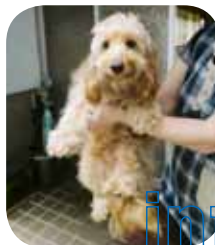
松井ちい(オス・2歳)