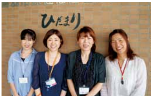
高齢者に関する相談は、わたしたちにおまかせください

地域包括支援センターでは、さまざまな高齢者に関する業務を行っていますが、特に知っていたいただきたいのは、高齢者の相談窓口になっているということです。 この相談業務は年々増加しており、相談内容もさまざまです。(表1) 最も多いのは、介護保険の在宅サービスの利用に関することや、介護保険の申請についてですが、認知症に関する相談も増えていきます。相談経路、相談方法は表2・表3のとおりです。 わたしたちは、高齢者のかたやその家族、地域で高齢者を見守っているかたが気軽に相談できるように努めていきますので、ぜひ利用してください。