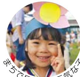
元気がみなぎって見かけたお友達

広報とばに掲載された 写真を差し上げます。 ご希望のかたは、総務 課広報情報係まで。