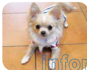
東川みみ(オス・1歳)