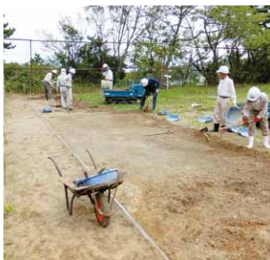
発掘作業を行っています

物は取り壊され、戦時中は軍の基地に、昭和4（1929）年からは小学校の運動場として使用されたため、お城の痕跡は目では確認することができません。昨年度、初めて発掘調査を行い、予想以上にお城の痕跡が残っていることが分かりました。そのため、今年も天守