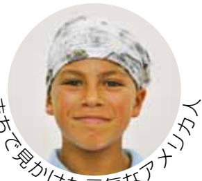
井上で見かけた元気なアフリカ人

広報とばに掲載された 写真を差し上げます。 ご希望のかたは、総務 課広報情報係まで。