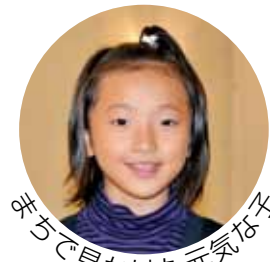
おめでとうで見かけた元気な子