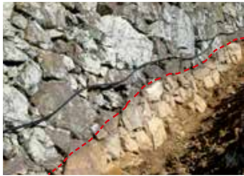
姿を現わした石垣(破線から下)

明治4(1871)年に鳥羽城が廃城になり、城の建物は取り壊され、石垣も多くが取り除かれました。それから現在に至るまで140年ほど経過していますが、これまで残存する石垣の修理などは一