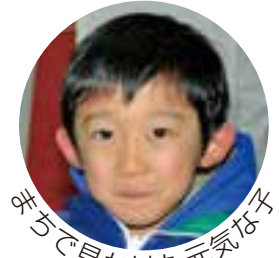
おちで見かけた元気な子

広報とばに掲載された 写真を申し上げます。 ご希望のかたは、総務 課広報情報係まで。