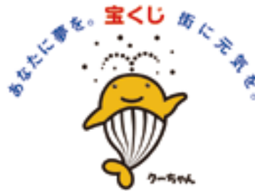
このマークは宝くじ助成事業で助成を受けた施設についています

市では、(財)自治総合センターから宝くじの普及広報活動の一環として行われている平成24年度コミュニティ助成事業を受けて、藤之郷町内会へ地域コミュニティ活動の活性化に向けた取り組みを行うため、集会所の改修を行いました。