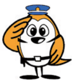
三重県警察 シンボルマスコット ミーポくん