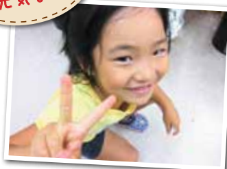
広報とばに掲載された写真を差し上げます。ご希望のかたは、総務課広報情報係まで。