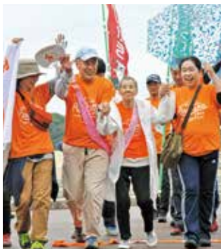
RUN 伴 2017の様子

1人または2人で参加を希望する場合は、8月15日(水)までに地域包括支援センターへ連絡してください。ランナーは長距離を走る、10メートルだけを歩く、といった個人の能力に合わせた距離での参加ができます。参加条件はありませんので、年齢や認知症の有無を問わず誰でも参加できますが、ランナーとして参加する場合はRUN伴Tシャツを着用する必要があります。みなさんの参加をお待ちしています。