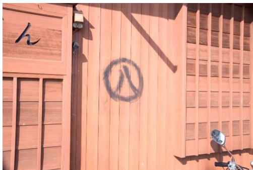
戸板に描かれた「まる八」印

鳥羽・志摩の海女漁村は他の漁村に比べて総じて明るい。それは女性が生き生きと暮らしているからである。この地域をめぐれば、古くから自然を敬い、海とともに生活してきた海女の生活と信仰が「海女文化」として、今も息づいていることが体感でき、元気な海女に出逢えば、彼女たちからパワーをもらえるに違いない。