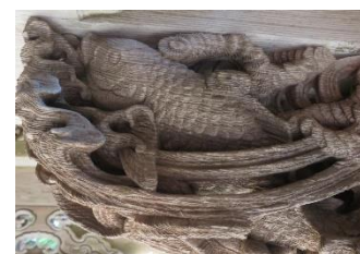
正福寺大門の魚の彫刻

特に青峯山正福寺は、鳥羽・志摩のみならず、伊勢湾周辺の漁業に携わる人々の厚い信仰を集める「海上安全祈願の聖地」である。正福寺の大門には海に関する寺らしく、龍などの彫刻に混じり「海老」や「魚」が隠れて彫刻されているほか、本堂の回廊には遭難者が奉納した嵐の中で祈る船乗たちの姿を描いた絵馬も掛けられており、探してみるのも面白い。